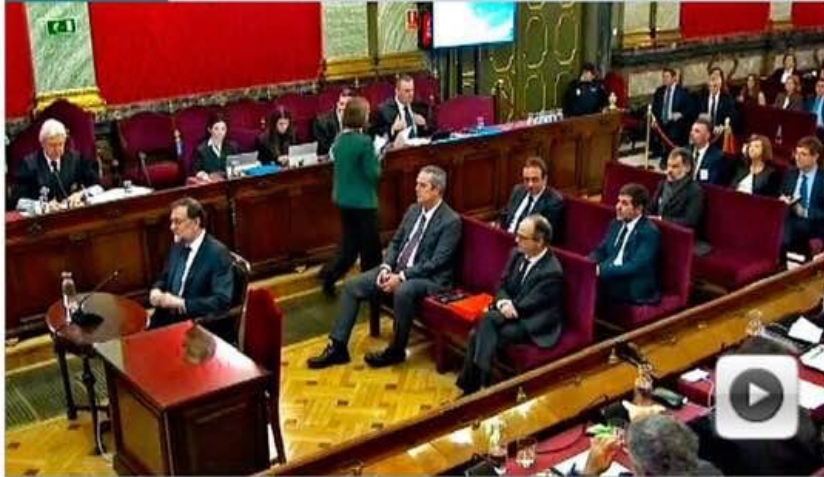
El ex presidente Mariano Rajoy, ayer, en el Tribunal Supremo, durante su declaración como testigo en el juicio a los acusados de organizar el 1-0.

JUICIO AL 'PROCÉS' RAJOY, TESTIGO EN EL SUPREMO